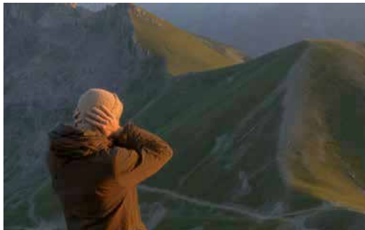
FAMOURAS Documentaire d'Amanda Robles