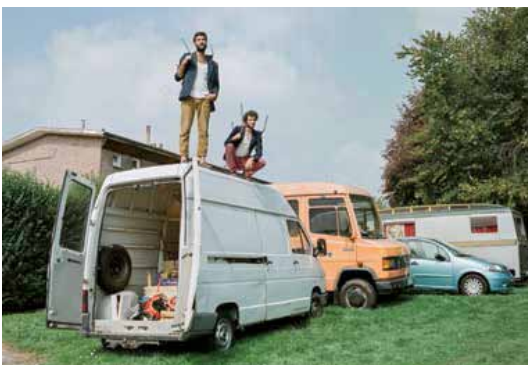
LE GOUFFRE Spectacle par la Cie Le Scrupule du Gravier