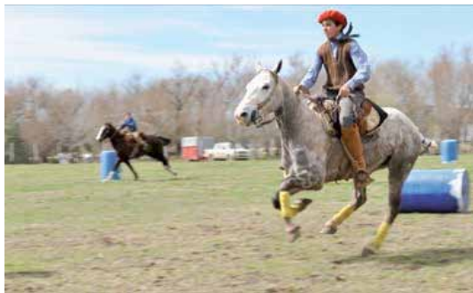
PIGÜE, LA TRAVERSÉE AVEYRONNAISE Diaporama par l'association Rouergue-Pigüe