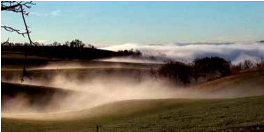
LE BONHEUR... TERRE PROMISE Documentaire de Laurent Hasse