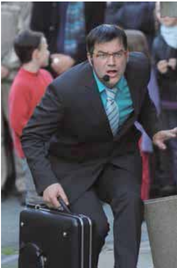
À VENDRE Spectacles, déambulations théâtrales par la Cie Thé à la Rue