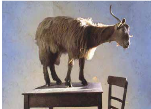
LE QUATTRO VOLTE Documentaire de Michelangelo Frammartino