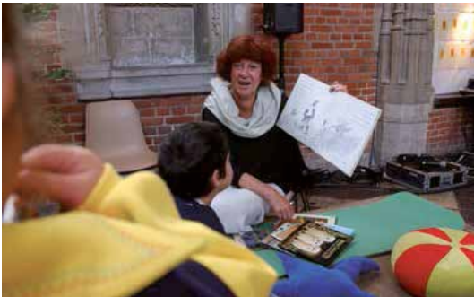
TRAVERSÉES... À VOIX HAUTE ! Littérature