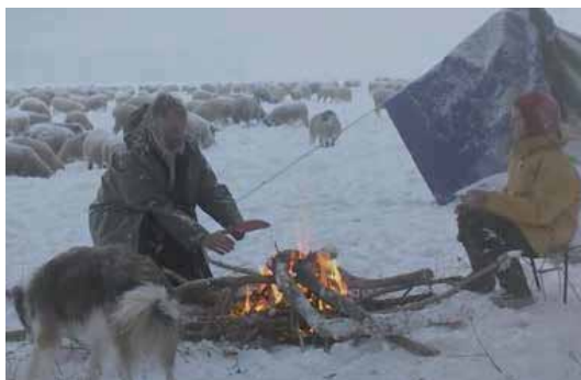
HIVER NOMADE Documentaire de Manuel Von Stürler