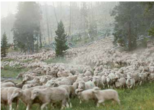
SWEETGRASS de Llisa Barbash et Lucien Castaing-Taylor Documentaire