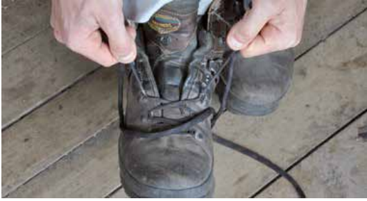
VERS CE QUI NOUS MET EN ROUTE Littérature