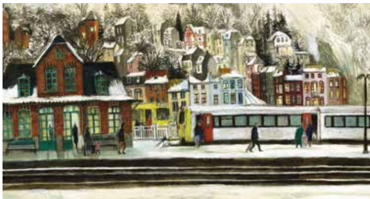
© Voyage d'hiver d'Anne Brouillard Editions Esperiète

Il existe des livres de toutes formes, de toutes tailles, des petits, des grands, des très grands, des allongés, des pliés, d'autres noirs et blancs, certains en couleur..., des livres qu'on lit assis, debout, couchés. Il existe aussi des livres qui se déplient, à la façon d'un accordéon ; des livres qui invitent à se déplacer.